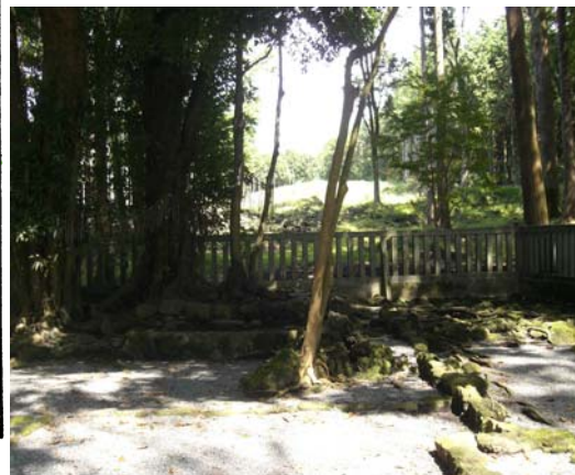
富士山を拝む場所 (遥拝所)