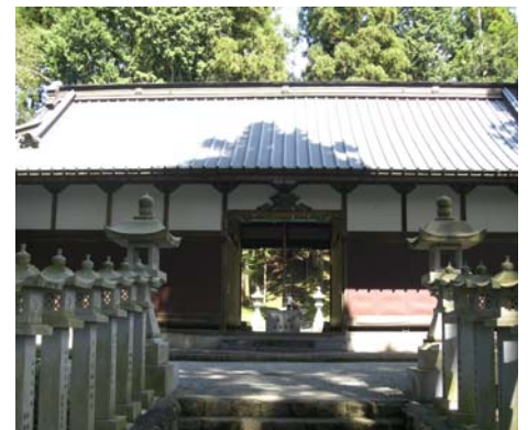
しゃむしょ 社務所 (籠屋)