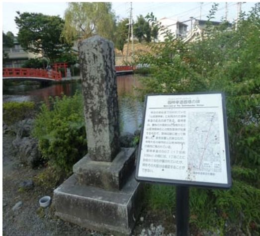
しゅひょう 首標 (浅間大社)