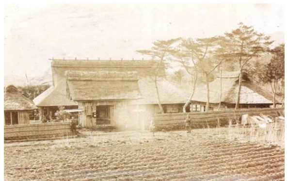
昔の赤池家の写真

赤池家は、富士講の人たちが人穴参詣にやってくるようになると、御法家とよばれ、修行の世話や、参詣者の休憩や宿泊ができるようにしました。