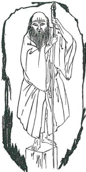
修行中の長谷川角行