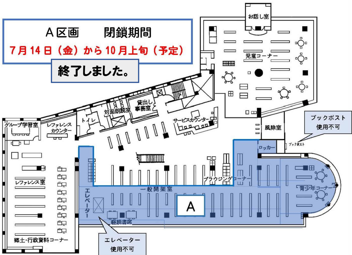
A区画：青少年、文庫、文学、6段書架（高い書架）